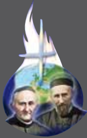
SS. Arnold Janssen und Joseph Freinademetz