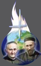
SS. Arnold Janssen und Joseph Freinademetz